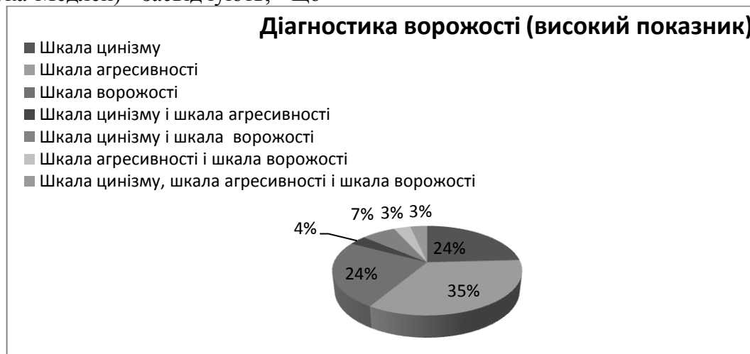
Рис. 5. Результати діагностики ворожості (високий показник)

високий показник за шкалою цинізму у 7 студентів (24%); за шкалою агресивності у 10 студентів (35%); за шкалою ворожості у 7 студентів (35%); одночасно за шкалами цинізму та агресивності у 1 студента (4%); за шкалами цинізму і ворожості у 2 студентів (7%); за шкалами агресивності та ворожості у 1 студента (3%) та за шкалами цинізму, агресивності та ворожості у 1 студента (3%). Результати представлені на рис. 5.