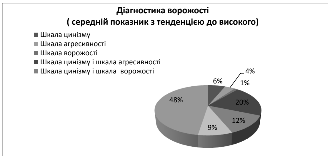
Рис. 6. Результати діагностики ворожості (середній показник з тенденцією до високого)

Середній показник з тенденцією до низького за шкалою цинізму у 1 студента (5%); за шкалою агресивності у 1 студента (5%); за шкалою ворожості у 15 студентів (79%);