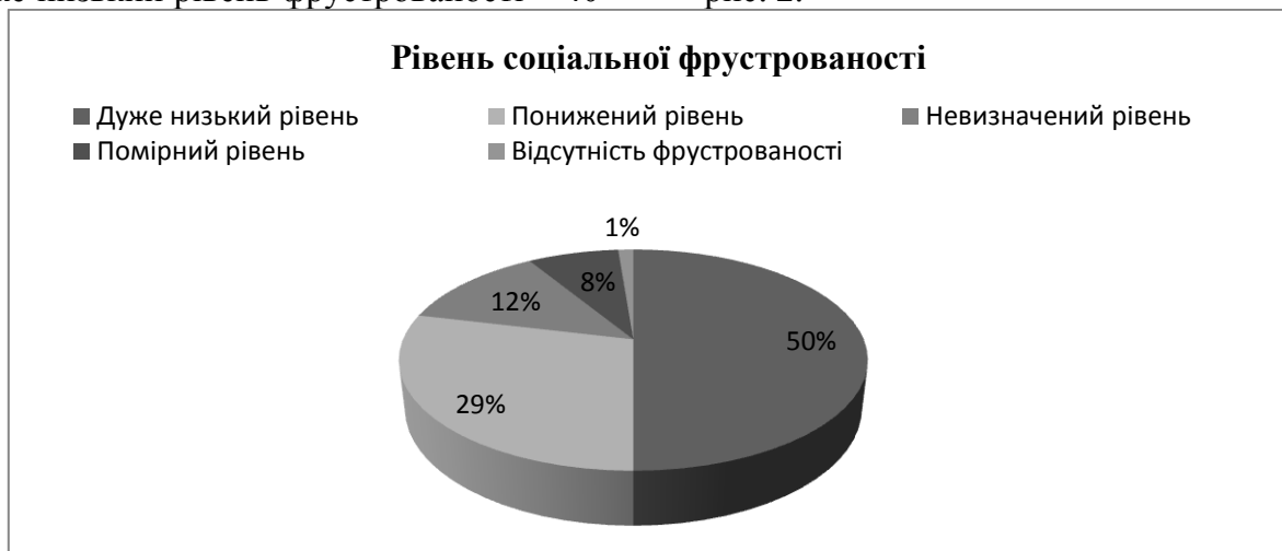
Рис. 2. Результати діагностики соціальної фрустрованості

осіб (50%); понижений рівень фрустрованості – 23 особи (29%); невизначений рівень – 10 осіб (12%); помірний рівень – 6 осіб (8%); у однієї особи відсутня фрустрованість (1%). Результати діагностики представлені на рис. 2.