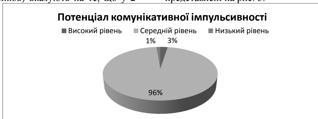
Рис. 3. Результати діагностики комунікативної імпульсивності

осіб (3%) комунікативна імпульсивність на високому рівні; у 77 осіб (96%) – на середньому рівні; у 1 особи (1%) – на низькому рівні. Результати діагностики представлені на рис. 3.