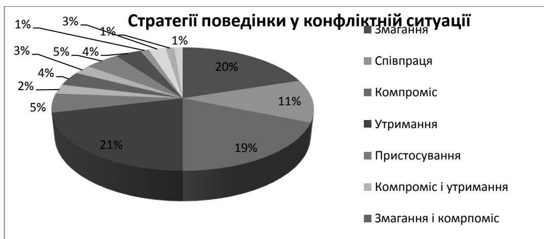
Рис. 4. Результати діагностики стратегій поведінки у конфліктній ситуації

Таким чином, хоч для більшості не притаманна соціальна фрустрованість і більшість проявляє середній рівень комунікативної імпульсивності, проте «Змагання» як стратегія поведінки з результатом 20% від загальної кількості перебуває на третьому місці, між показниками «Утримання» та «Компроміс».